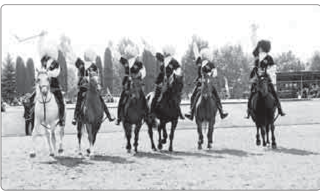
(Клэуыр. Пэцлэдэр 1-нэ нап.)

Зэрыэхъа шхъэкӱ, «фыцӱгӱэр» нӱхъ лӱэшу кыцӱлӱри, кытеуахэм бгырыс шылӱрысхэр зы тӱлайкӱ кыхагӱэшӱащ, шылӱри мафӱз бзишхуэм зӱцӱрагӱэщӱащ, Аршхъэкӱ, куэд дӱмыкӱу «кыргӱэжыа» уафӱгӱагӱауэ зыцӱт ушхышхуэм шылӱэр зыуфӱа мыхуымыцӱгӱэр тригӱэ-кыбзыкыжащ, кыӱхъуа-кыӱцӱлӱхэр зӱцӱлӱбзӱаежу нӱхуӱгӱэ инри кыдӱкӱлӱжӱащ, нып хужышхуахэр зыгӱгӱахэрэ шӱлӱлӱхэри утыкум кыӱхъӱащ. Абыхэм ягӱгӱахуэжӱа ныжыкы-шӱлӱхэр нӱхъ уардӱжу икӱ нӱхыбӱжу кыӱзӱцӱлӱвӱжӱащ, шхъуэцӱлӱпкыкӱбзӱаежу ялыгӱгӱэ дзӱ гӱгӱахэр зӱ-шӱлӱгӱэсысӱрӱ гӱфӱлӱгӱуэ иным зӱцӱлӱшӱахуэ.