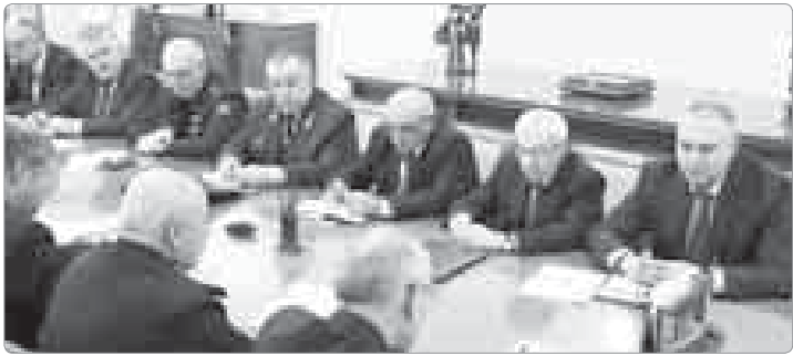
Дыгуасэ Клуэкуэ Ю. А. КЪБР-и и Правительствэм и Унэм иригъэклуэклащ хабзэхъумэ, суд органхэм я унафэщхэм я зэлүщлэ.

КЪБР-и и Игъашхэм къы- зэкусасар шыгуауэ ищлэ Террорим пощтэнымкк лъэлкъ комитетым и унафэщ, Урсыем Шынагуэи- шыгъэмкк и Федеральнэ къулыкъуащлэпэм и унафэщ