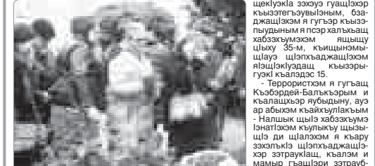
2005 гъэм жэпугъуэм 13-м террорист шыпхъаджэхэр Налшык къалэ къыщытхуэ махуэм хэ- куэда хабзэхъумэ и фэеллэ жыг 35-рэ шы- саш республикэм и къа- лашхэм.

Клуэда я лъахуэр хуэм я фэеллэры апуэдэ шы- кккэ уахъыншэ ящынэ зэрхуейр.