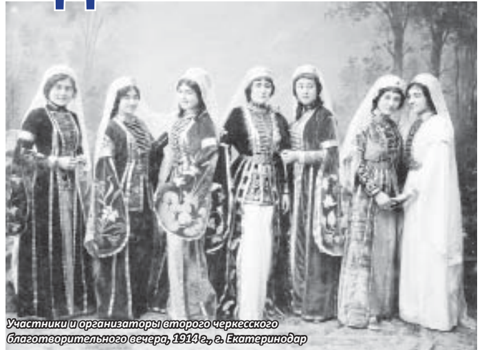
Участники и организаторы второго Черкесского благотворительного вечера, 1914 г., в. Екатеринодар