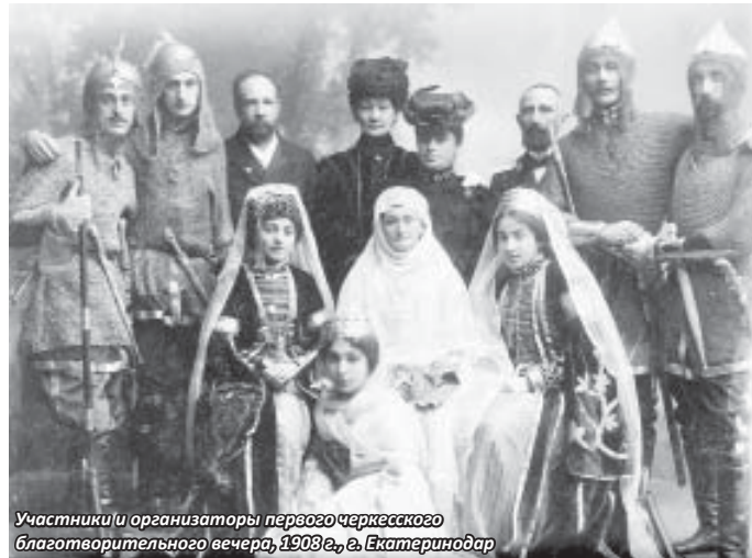
Участники и организаторы первого Черкесского благотворительного вечера, 1908 г., в. Екатеринодар

званный, по свидетельству очевидца, «небывалый интерес и наплыв публики» не только из Екатеринодара, но и «из самых отдаленных мест Кубанской и Терской областей». Вечер состоял из трех отделений. В первом звучала адыгская музыка, во втором, основном, вниманию многочисленных зрителей было предложено красочное театрализованно-этнографическое представление в «живых картинах» на темы и сюжеты из истории, традиционной культуры и быта коренных жителей края. Вечер завершился «обыкновенными танцами». Вот что писала об этом событии газета «Кубанские областные ведомости»: «В пятницу, 18 января, в помещении второго общественного собрания состоялся вечер, устроенный местной черкесской интеллигенцией в пользу горцев, пострадавших от наводнения и привлечший в зал собрания небывалое число зрителей, заполнивших все входы и выходы, так что многим пришлось чуть ли не лежать друг на друге. Особенностью вечера были живые картины из горской жизни в национальных костюмах при соответствующей обстановке, прошедшие очень удачно и вызвавшие шумные одобрения. Среди зрителей на этот раз было очень много представителей черкес и черкешенок в своих национальных костюмах. По окончании картин начались танцы, затянувшиеся до четырех часов ночи. Материальная выручка вечера, как нам передавали, превысила 2000 руб. Словом, вечер оказался во всех отношениях в высшей степени удачным».