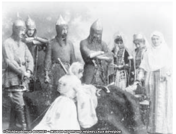
«Оплакивание воина» - живая картина черкесских вечеров

тельскому проекту общества – первым в истории народного образования адыгов национальным педагогическим курсам. Первые курсы учителей родного языка и мусульманского вероучения, подготовленные по инициативе и на средства «Черкесского общества», состоялась летом 1914 года в селении Тахтамукай. Об этом вечере писали в кубанской прессе: «...Черкесский вечер может почитаться не только культурным удовольствием, но может иметь отчасти и общественно-историческое значение. Через средство живых картин открылся уголок минувшей жизни черкесских племен, мало исследованных в исторической литературе. Сухие страницы книг не дадут нам того, что может дать верная, живая историческая картина. Правда, интерес вечера местный, но все же должен вызвать общее сочувствие, так как может дать многое в смысле изучения быта и жизни туземного населения...»