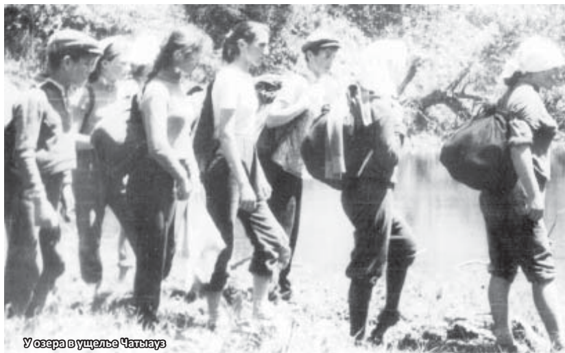
У озера в ущелье Чатыгауз

Спускаясь к реке, в самом начале Чегемского ущелья