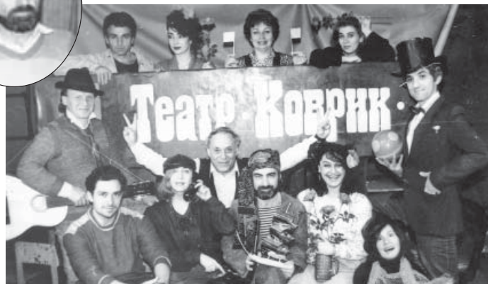
«ковриковскую» атмосферу придали две зарисовки - «Маленький принц» и «Черная бурка». «Маленький принц» стал последним спектаклем, поставленным Казбеком в Нальчике на сцене Общедоступного театра «Фатум», а «Черная бурка» – последним