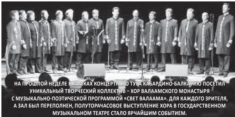
НА ПРОШЛОЙ НЕДЕЛЕ В РАМКАХ КОНЦЕРТНОГО ТУРА КАБАРДИНО-БАЛКАРИЮ ПОСЕТИЛ УНИКАЛЬНЫЙ ТВОРЧЕСКИЙ КОЛЛЕКТИВ — ХОР ВАЛААМСКОГО МОНАСТЫРЯ С МУЗЫКАЛЬНО-ПОЭТИЧЕСКОЙ ПРОГРАММОЙ «СВЕТ ВАЛААМА». ДЛЯ КАЖДОГО ЗРИТЕЛЯ, А ЗАЛ БЫЛ ПЕРЕПОЛНЕН, ПОЛУТОРАЧАСОВОЕ ВЫСТУПЛЕНИЕ ХОРА В ГОСУДАРСТВЕННОМ МУЗЫКАЛЬНОМ ТЕАТРЕ СТАЛО ЯРЧАЙШИМ СОБЫТИЕМ.

С тех пор сольные выступления хора состоялись на самых престижных академических концерт-