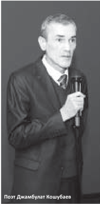
Поэт Джамбулат Кошубаев

21 НОЯБРЯ, В ПЕРВУЮ ГОДОВЩИНУ СМЕРТИ ТАЛАНТЛИВОГО ПОЭТА И ПЕРЕВОДЧИКА ГЕОРГИЯ ЯРОПОЛЬСКОГО, СОСТОЯЛСЯ ВЕЧЕР ПАМЯТИ В ЛИТЕРАТУРНОМ САЛОНЕ. ОН СОБРАЛ ПОЧИТАТЕЛЕЙ ЕГО ТАЛАНТА.