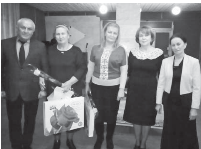
День матери в Доме культуры п. Кашхатау Черковского района