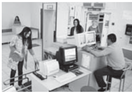
Зачастую граждане везут автомобили Минераловодской таможни

В новых геоэкономических условиях и в связи с ухудшившимися отношениями с Украиной и Турцией в последние месяцы товарооборот между нашими странами существенно снизился. Однако, несмотря на сложившуюся ситуацию, Кабардино-Балкарский таможенный пост Минераловодской таможни и в дальнейшем будет стремиться к повышению скорости совершения таможенных операций, снижению издержек участников внешнеэкономической деятельности и оказанию им всесторонней поддержки в сложных экономических условиях. Вёр