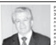
Кабардино-Балкарский Республиканский музей