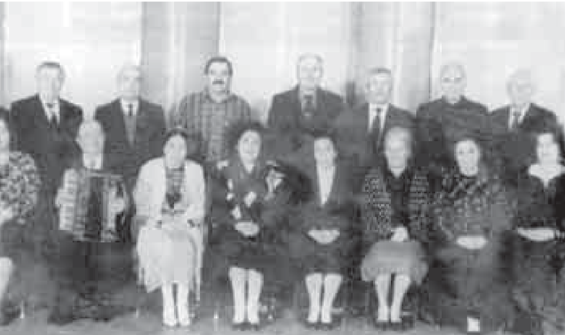
Работники республиканского радио сохранили фотографию, на которой запечатлены ветераны хора. Всего в коллективе было 32 человека. «КБП» будет благодарна читателям, которые смогут предоставить редакции снимок хора в полном составе