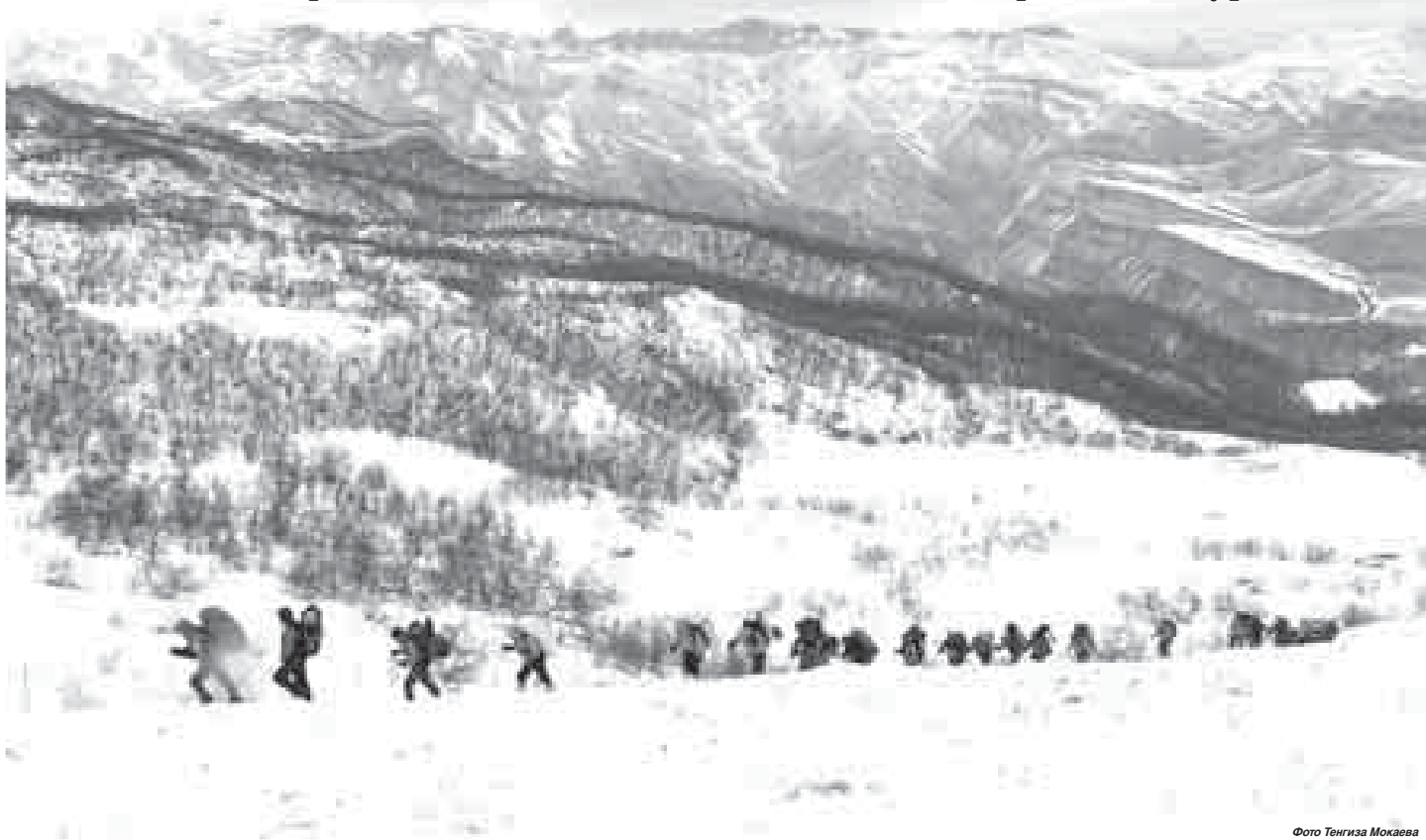
Фото Тенгиза Мокаева