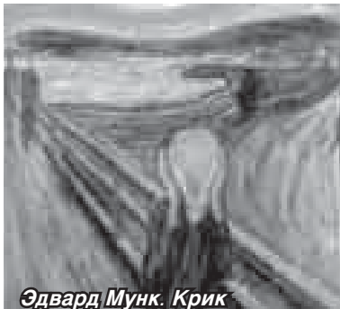
Эдвард Мунк. Крик