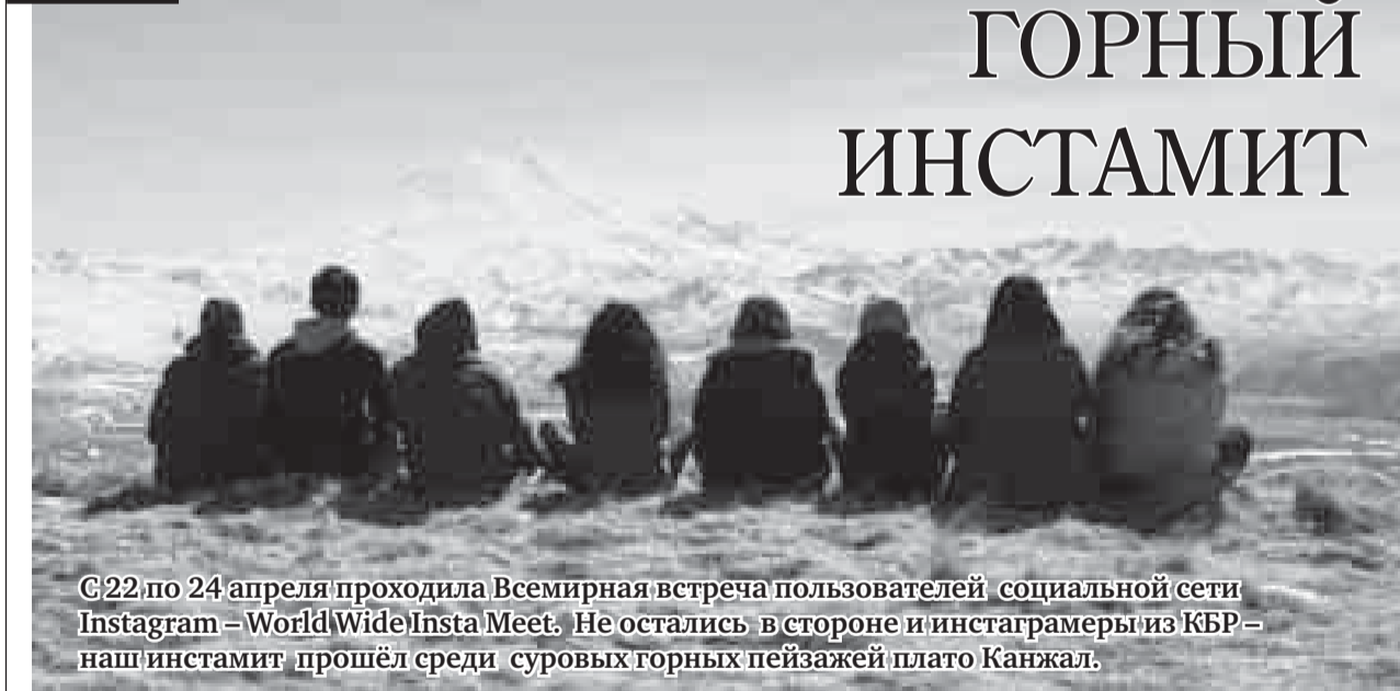
©22 по 24 апреля проходила Всемирная встреча пользователей социальной сети Instagram – WorldWideInsta Meet. Не остались в стороне и инстаграмеры из КБР – наш инстамит прошёл среди суровых горных пейзажей плато Канжал.