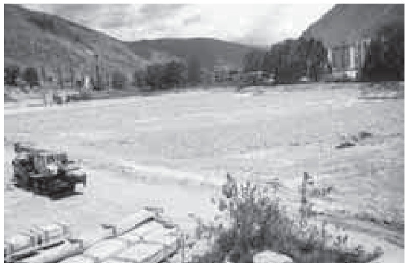
Пруды для выращивания рыбы

В КОТЛОВАНЕ БЫВШЕГО ТЫРНЫАУЗСКОГО ГОРОДСКОГО ОЗЕРА РАЗВЕРНУЛАСЬ БОЛЬШАЯ СТРОЙКА – СООРУЖАЮТСЯ ОБЪЕКТЫ ПРОИЗВОДСТВЕННОГО КОМПЛЕКСА ПО ВЫРАЩИВАНИЮ ЦЕННЫХ ВИДОВ ПРОМЫСЛОВОЙ РЫБЫ.