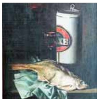
Натюрморт с рыбой

Работая в технике станковой и монументальной живописи, сочетает реализм и авангард, пишет картины в таких жанрах, как пейзаж, портрет, натюрморт и жанровая картина. Живопись Бориса Гуданаева отличается колоритностью