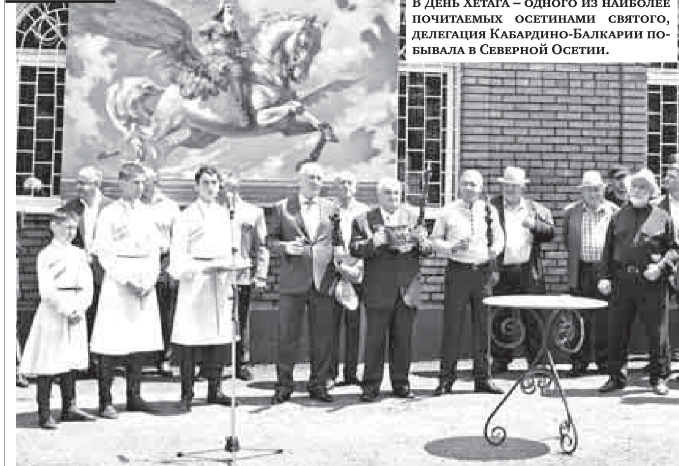
В День Хетага – одного из наиболее почитаемых осетинами святого, делегация Кабардино-Балкарии побывала в Северной Осетии.