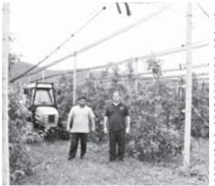
Агрофирма «Перспектива» (с.п. Куба) – первый в республике суперинтенсивный сад по итальянской технологии

(Окончание. Начало на 1-й с.) Если говорить конкретно о Баксанском районе, то здесь в 1990 году было всего 1274 гектара садов со средней урожайностью 3,5 тонны с гектара, объемы годового урожая составляли 170 тонн плодов. Сегодня же с переходом на новые технологии садоводы Баксанского района уже собирают свыше 40 тысяч тонн плодов с высокими конкурентоспособными свойствами.