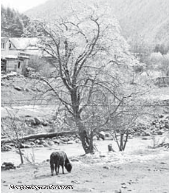
В окрестностях Тегенекли

В 1935 году был установлен рекорд массового посещения Эльбруса: за год на вершине побывали 2016 альпинистов.