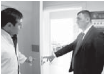
Алим Асанов встретился с главным врачом учреждения Рустамом Калиботовым, проверил ход перепрофилирования больницы. В беседе с коллективом он особо подчеркнул: «Ваше учреждение выходит на третий уровень, здесь будет оказываться высокотехнологичная и специализированная медицинская помощь. От коллектива требуются максимальная мобилизация и соответствие новым требованиям и задачам. В развитие данного учреждения республика вложила немалые средства, результат должен быть максимальным».

И.о. министра здравоохранения КБР Алим Асанов побывал в рабочим визитом в больнице С. Анзорей, которая в августе стала структурным подразделением межрайонной многопрофильной больницы Нарткалы.