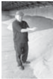
(Окончание. Начало на 1-й с.)