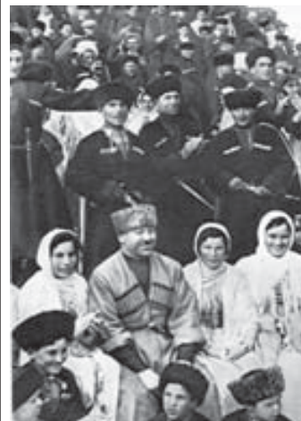
«СССР на стройке» был призван создавать положительный образ происходящих в стране кардинальных изменений в индустриальном, научно-техническом и социальном укладе, прежде всего в лазах зарубежной аудиторией: недаром журнал переводился и издавался на пяти языках.

Первые выпуски ежемесячного иллюстрированного журнала новостей и пропаганды «СССР на стройке» датируются 1930 годом, и на протяжении следующих 11 лет, вплоть до самого начала Великой Отечественной войны, каждый новый номер становился событием в общественно-политической жизни тогда ещё совсем молодой и набирающей силу Советской империи. 80 лет назад – в октябре 1936 года вышел номер журнала, посвящённый 15-летию Кабардино-Балкарии, – как раз в те дни, когда в республике полным ходом шло празднование знаменательной даты. Для подготовки выпуска нашу республику посетил фотокорреспондент издания Георгий Петрусов.