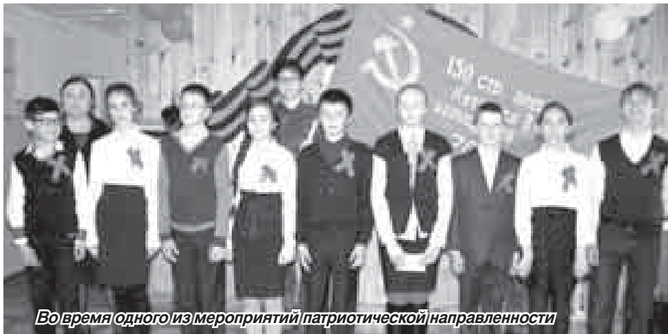
Во время одного из мероприятий патриотической направленности

тивный залы, в посёлке нет клуба. До районного центра Тырнауза, где созданы все условия для получения дополнительного образования, – функционируют Дворец культуры, центр развития творчества детей и юношества со множеством кружков по интересам, детская школа искусств, спортивные комплексы и другие учреждения – сорок километров. Регулярно возить детей на занятия не представляется возможным, да и зимой в условиях высокогорья это небезопасно. К плюсам можно отнести то, что Приэльбрусье – между-