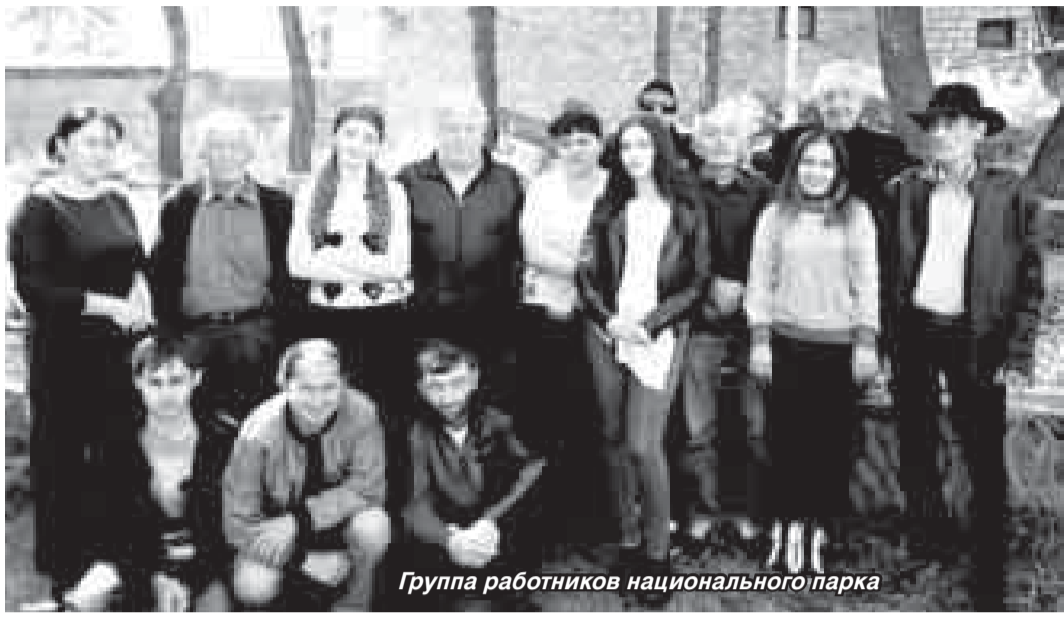
Группа работников национального парка

Позже его переименовали в национальный парк «Приэльбрусье» и подчинили Федеральной службе по надзору в сфере природопользования, а затем передали Министерству