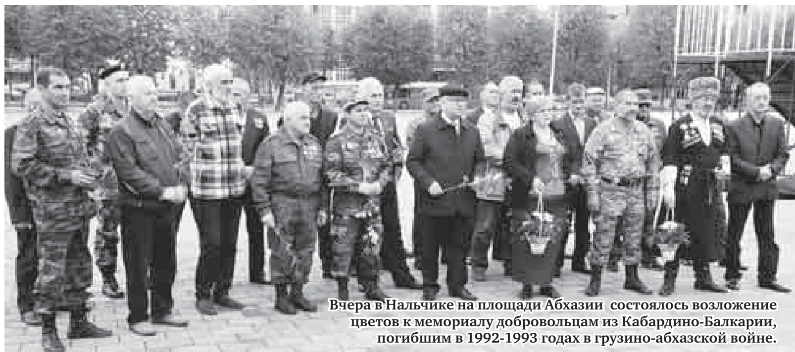
Вчера в Нальчике на площади Абхазии состоялось возложение цветов к мемориалу добровольцам из Кабардино-Балкарии, погибшим в 1992-1993 годах в грузино-абхазской войне.

В этот день, 30 сентября 1993 года в 19 часов 30 минут война в Абхазии закончилась победой. Из Кабардино-Балкарии на помощь братскому абхазскому народу пришли 1562 добровольца, из них 61 человек погиб, четверо пропали без вести. 26 августа 2008 года Российская Федерация и ряд других государств признали Республику Абхазия независимым и суверенным государством.