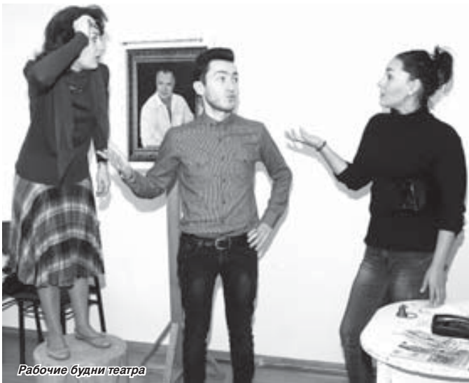
Рабочие будни театра