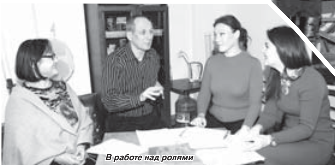
В работе над ролями

В список объектов Нальчика, включённых в план 1945 года, входило восстановление здания кинотеатра под драматический театр. Первоначально здание драмтеатра проектировалось под малые формы, предусматривалось печное отопление, асфальтовые полы. В процессе строительства было решено строить здание с расчётом размещения в нём двух театров: Кабардинского и Русского. В соответствии с новым проектом объём здания увеличился, отопление стало центральным, а полы паркетными. Комсомольцы, школьники, рабочие и служащие столицы республики добровольно участвовали в строительных работах.