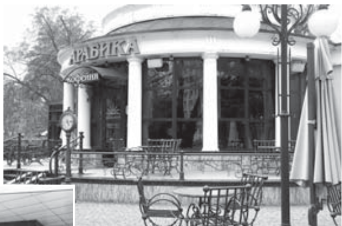
Выглядят они не только стильно, но и вполне уместно. Колонны украшают кинотеатр «Победа», фасады зданий и вход в детский городок аттракционов.

С другой стороны сквера расположился домик с колоннами. Это одно из самых старых зданий в республике. В девятнадцатом веке в этом доме размещалось Управление центра кавказской линии. Здесь бывал Александр Сергеевич Грибоедов и даже оставил воспоминания о своей поездке в Нальчик. Если верить табличке на стене, этот памятник архитектуры охраняется государством, хотя по виду здания этого не скажешь.