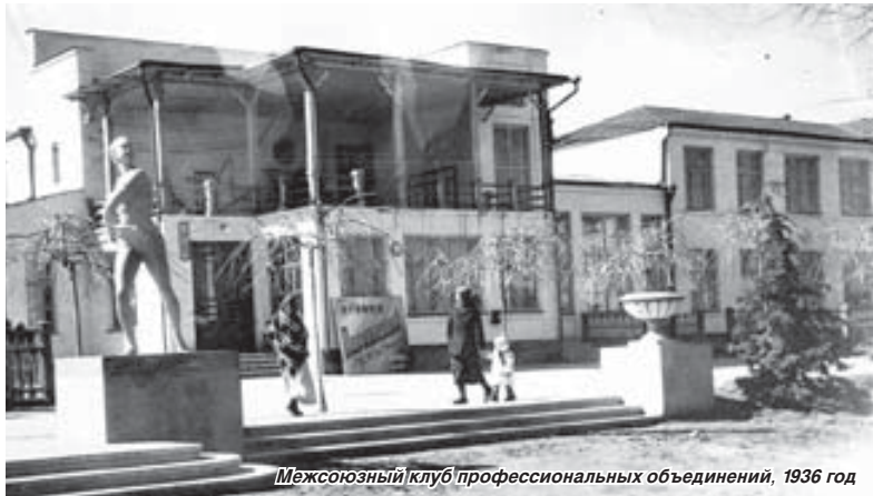
Межсоюзный клуб профессиональных объединений, 1936 год

В эти дни Русский драматический театр имени М. Горького готовится к открытию юбилейного восьмидесятого сезона. Впервые занавес государственного Русского драматического театра был поднят 1 ноября 1936 года.