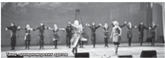
Танец причерноморских адвгов