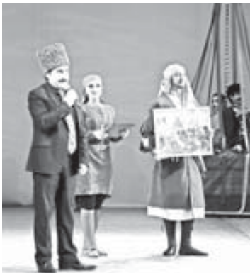
Танец причерноморских адвгов