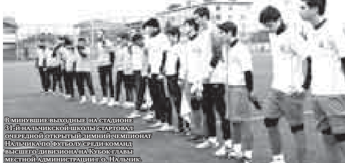
В МИНУВШИЕ ВЫХОДНЫЕ НА СТАДИОНЕ 31-Й НАЛЬЧИКСКОЙ ШКОЛЫ СТАРТОВАЛ ОНЕРЕДНОЙ ОТКРЫТЫЙ ЗИМНИЙ ЧЕМПИОНАТ НАЛЬЧИКА ПО ФУТБОЛУ СРЕДИ КОМАНД ВЫСШЕГО ДИВИЗИОНА НА КУБОК ГЛАВЫ МЕСТНОЙ АДМИНИСТРАЦИИ ГО. НАЛЬЧИК.