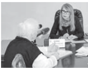
предложили алгоритмы решения той или иной проблемы. Кроме того, заявители получили исчерпывающую

Обращения граждан к спикеру Парламента КБР были самые разнообразные. Но вопросы, касающиеся сферы жилищно-коммунального хозяйства, были наиболее актуальными. Заявители подняли ряд вопросов, касающихся проведения капитального ремонта многоквартирных жилых домов, неправомерного наложения коммунальных платежей обществу за содержание общего имущества многоквартирного дома. Среди рассмотренных обращений были вопросы, касающиеся увековечения памяти ветерана Великой Отечественной войны, обеспечения жильём молодой семьи.