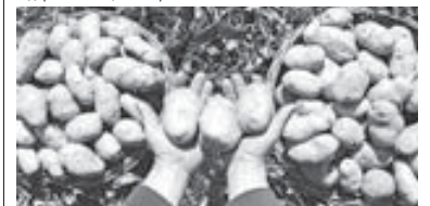
По материалам информгентств

Сохранять ценные сорта позволяют уникальный климат и особенности ландшафта. Основной секрет качественных семян – высокогорье. Чем выше над уровнем моря расположен экспериментальный участок, тем меньше корневой паразитов и болезней. Сейчас уже создано пять новых сортов, которые дают небывалую урожайность. Таким образом, республика может вскоре стать лидером селекции «второго хлеба».