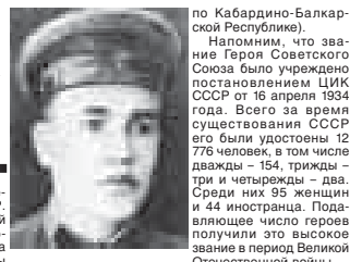
Указом Президиума Верховного Совета СССР от 25 октября 1943 года за образцовое выполнение боевых заданий командования на фронте борьбы с немецко-фашистскими захватчиками и проявленные при этом мужество и героизм сержанту Тарану Петру Тихоновичу было присвоено звание Героя Советского Союза (посмертно). Приказом КГБ при Совете Министров СССР от 30 апреля 1965 года Герой Советского Союза сержант Таран Петр Тихонович навечно зачислен в списки личного состава 21-й пограничной заставы 43-го Краснознаменного Пришيبского пограничного отряда.

Статус высшей военной награды был возвращён ордену в 2000 году. А в 2007 году российские парламентарии выдвинули идею о возрождении праздника. Авторы законопроекта пояснили, что возрождение традиции празднования Дня героев – это не только дань памяти героическим предкам, но и чествование ныне живущих героев Советского Союза, героев Российской Федерации, кавалеров орденов Святого Георгия и Славы. Также они выразили надежду, а огнём из автомата – 14 вражеской солдат. Она бружит, что закончил все боеприпасы, он не растерялся и ударами приклада вывел из строя ещё двоих гитлеровцев. 9 мая 1943 года сержант Таран погиб в бою во время атаки на вражеский ДОТ близ выноса хоза «Саук-Дере» Крымского района Краснодарского края. Похоронен у шоссе/ной дороги близ селения Молдаванское этого же района.