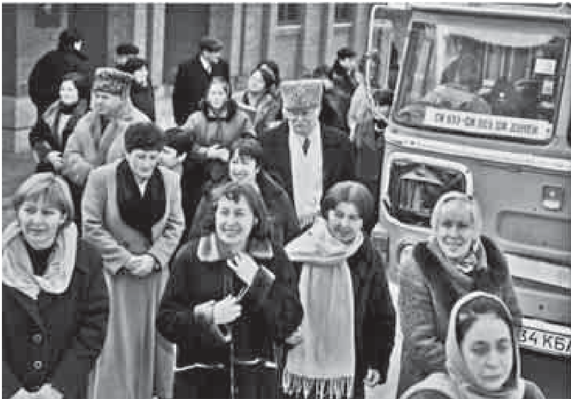
Члены жюри конкурса «Си бзэ – си псэ, си дуней» прибыли в селение Дейское Терского района КБР

Общественная деятельность нашего героя выделяет его на фоне тех, кто решил подвизаться на этом поприще под воздействием амбиций либо банальных меркантильных интересов. В КБР есть немало общественных объединений, руководители которых претендуют на лидерство в выражении интересов адыгского народа, но при этом, положа руку на сердце,