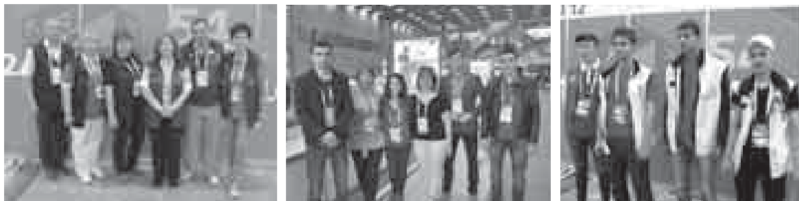
Команда представителей Кабардино-Балкарии на площадке Крокус-Экспо в подмосковном Красногорске, финал

2016» по рабочим профессиям с участием молодых представителей рабочих специальностей 18-22 лет. Среди студенческой и работающей молодёжи Северо-Кавказского федерального округа (Дагестан, Южная Осетия, Ингушетия, Кабардино-Балкария, Северная Осетия) победителем чемпионата в компетенции «Облицовка плиткой» стал студент 4 курса Кабардино-Балкарского колледжа «Строитель». Выход команды Кабардино-Балкарии в финал престижного профессионального соревнования, несомненно, стал значительным шагом в создании позитивного имиджа рабочих профессий и, соответственно, серьёзным шагом на пути создания в республике квалифицированных рабочих кадров.