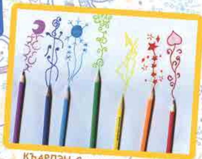
КЪАРДЭН Салимэ, илъэс 12 мэхъу