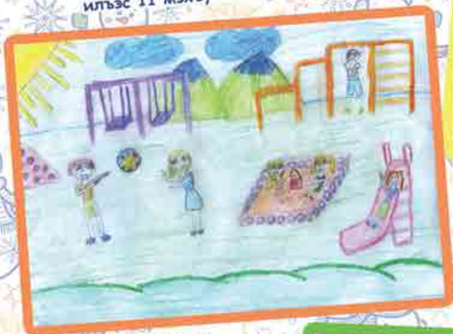
КУЖОКОВЭ Зульфия, илъэс 11 мэхъу