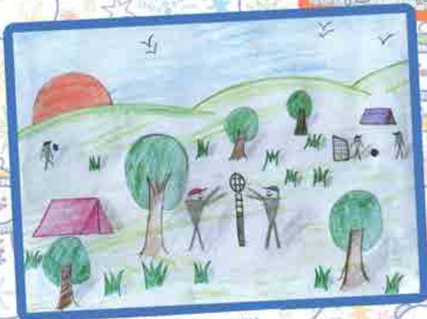
ВЭРМАХУЭ Андемыркъан, 5 «Б» класс