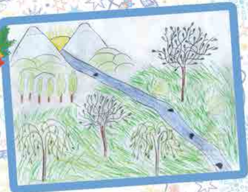
ДОЛ Ислѡам илъэс 11 мэхъу