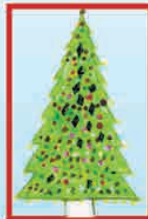
Сур. Жашууланы А., Нальчик, 3-чю шк.