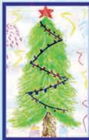
Сур. Глазева В., Нальчик, 3-чю шк.

« Ыйых кюнме », келигиз Бир къонакълыкъ этигиз. Арыгъан да болурсуз, Бир кесекге солурсуз.