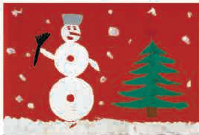
Сур. Азаматланы Амирниди, Нальчик ш., 3-чю школ.