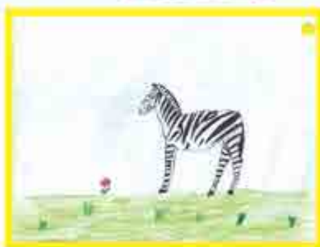
Сур. Хуламханланы А., Бызынгы эл.