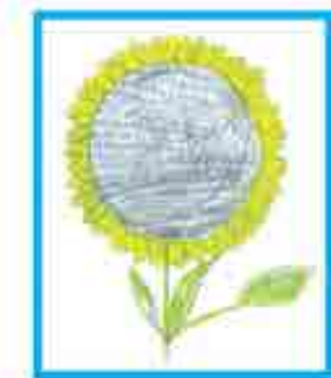
Сур. Чеченланы Т., 3-чю школ, Нальчик ш.