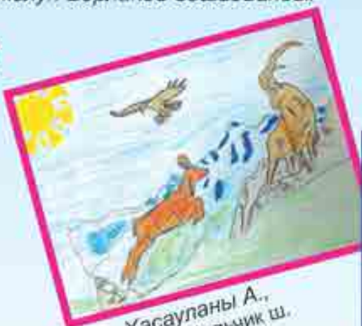
Сур. Хасаулары А., 3-чю школ, Нальчик ш.

Кьарайды жаралы терек, Кьайгьылы солдат анача, Кьабыргьасына топ окьну Сыныгьы кирип, кьамача.