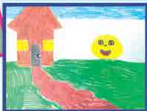
Сур. Ульбашланы З., 3-чю школ, Нальчик ш.