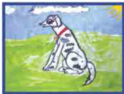
Сур. Османланы Ж., 18-чи школ, Нальчик ш.

«Жигитле кереем сиз! Кючлю ёшюн салдыгъыз. Хорламагъанед киши, Сиз онгуму алдыгъыз!»