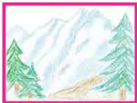
Сур. Бёзюланы Б. Нальчик. ш. 3-чю школ