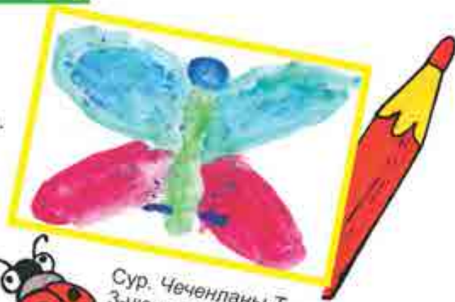
Сур. Чеченланы Т., 3-чю школ, Нальчик ш.