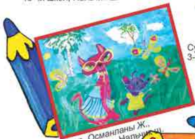
Сур. Османланы Ж., 18-чи школ, Нальчик ш.