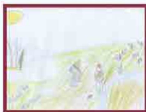
Сур. Муртазланы А., 3-чю школ, Нальчик ш.