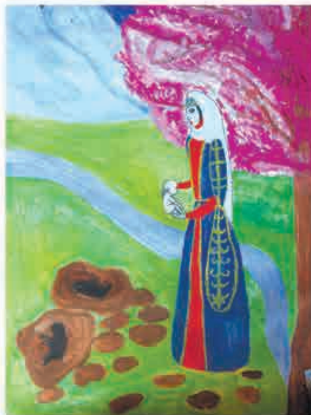
Сур. Жабелланы Камилланыды

Нартла бир бирлеринден жукъ тилеселе, угъай деген төре болмагъанды. Дебет, ол жашчыкъны деу пелиуан боллугъун кёрюп, аны, темирчи этип, усталыгъына юйретир мурат этгенди. Алай нарт къойчула тилегенде, сабийни алагъа къойгъанды. Жашчыкъгъа нартла «Бёрю эмчек» деп атагъандыла. Арта, ол,