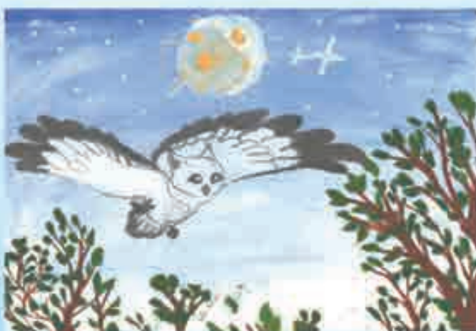
Сурагла Забакъланы Лейляныдыла