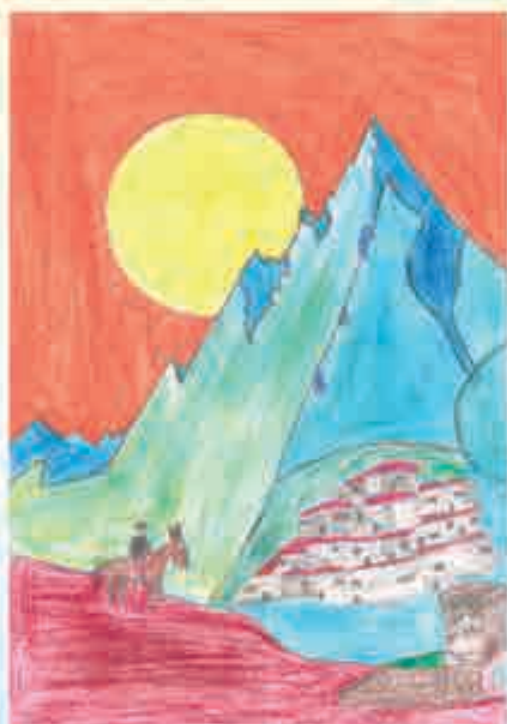
Сур. Гаджикурбанов Ильханныды