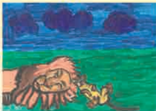
Сур. Афашокъаланы Айшатныды

Чаппа, чаппий, чаппачыкъ, Сен аланы кий да чыкъ! Бири – онгду, бири – сол! Тюз кийгенни сакълайды жол.