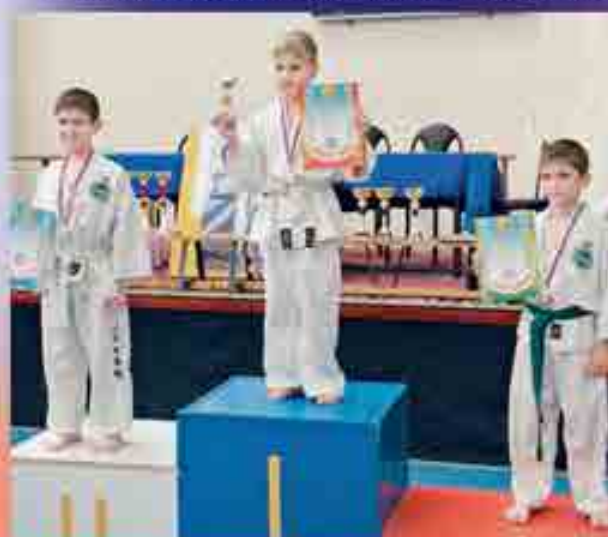
Алты сермешип 1-чи жерге алты жерге кѳтюрюлгѳн