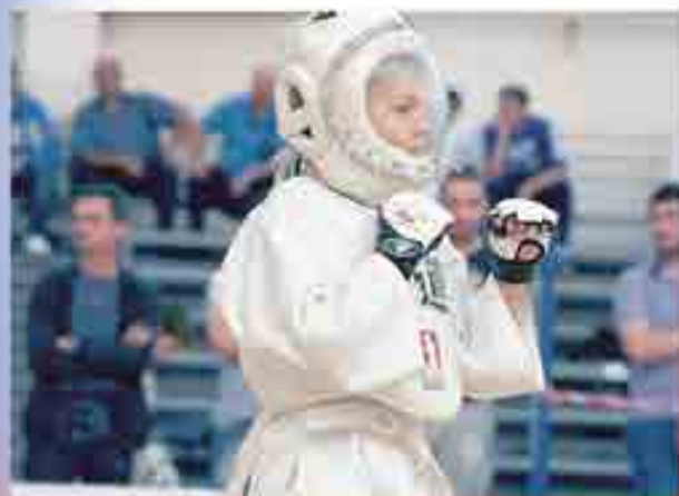
Тамерлан сермешген кезинде