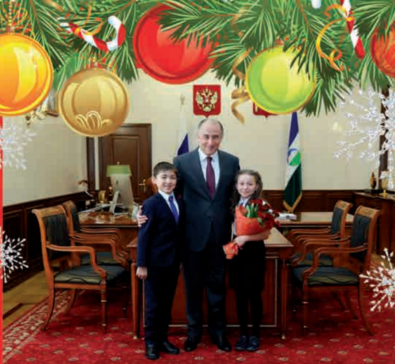
Къабарты-Малкъар Республиканы Башчысы Юрий Коков фахмулу сабийле бла тюбешген кезиу