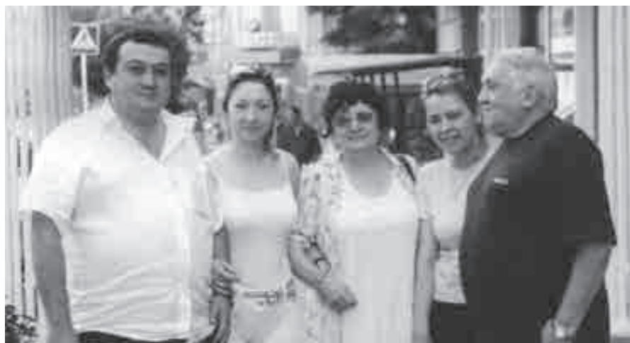
Вэрокъуэ Владимир и унагъуэр и гъусэу.

– Владимир, уи гур хагъахъуэрэ уи лъэр щIагъэкIыу нобэ уи уна-гъуэм исхэр дыбгъэщIыхуну сыхуейт.