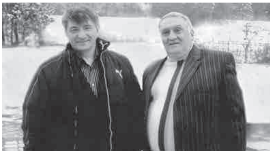
Кинорежиссёр цIэрыIуэ Сокуров Александр и гьусэу.