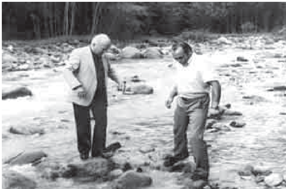
КIьщокъуэ Алимрэ Бицу Анатолэрэ. ПсыкIэху. 1984.