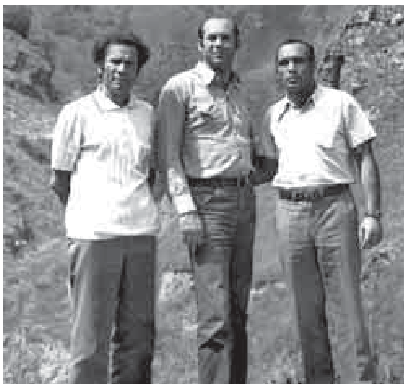
СэмэгумкIэ кыщыщIэдзауэ: тхакIуэ Журт Биберд, Олимп джэгухэм я чемпион Брумель Валерий, Бицу Анатолэ сымэ. 1981.