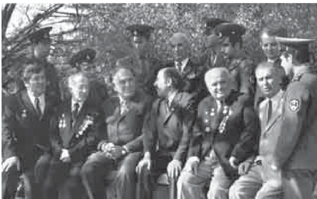
Къэбэрдей-Балькъэрым и тхаклуэхэр Хэкум и хъумакулэхэм ялуощІэ. 1975