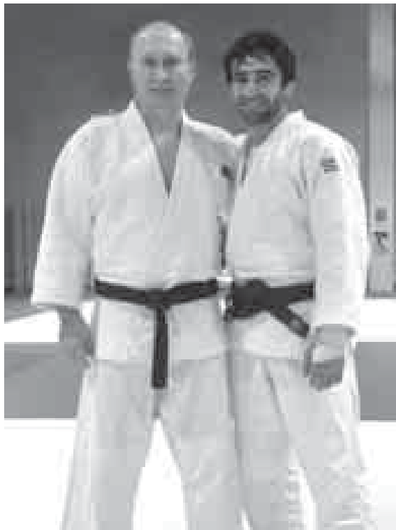
Путин Владимиррэ Мудрэн Бесльэнрэ.

Урысей Федерациэм и Президентым игу кыэкылажашч Такатэрэ Мудрэннымрэ иужьбу зэрызэбэнар зэрилыэгъуар. Зышчыщ лэп-