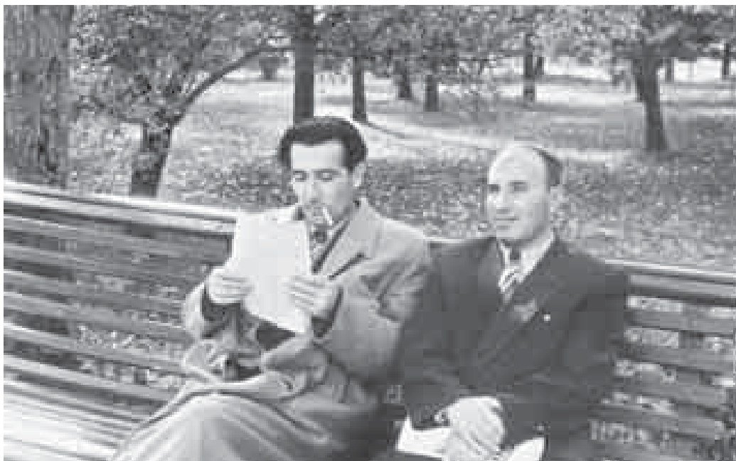
Тхаклуэхэу Нало Ахьмэдхъанрэ Щоджэнцлыкү Іэдэмрэ.