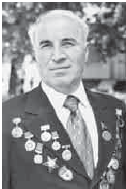
Къэбэрдей-Балъкъэрым и цыхубэ усакуэ ЩоджэнцыкIу Iэдэм.