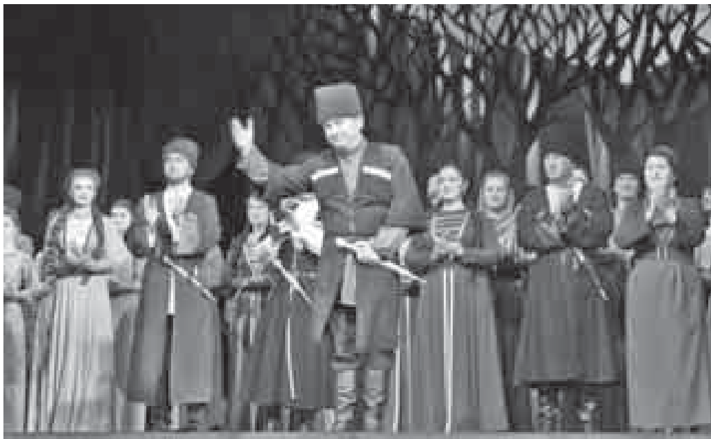
«Мадинэ» оперэм хэтахэр.