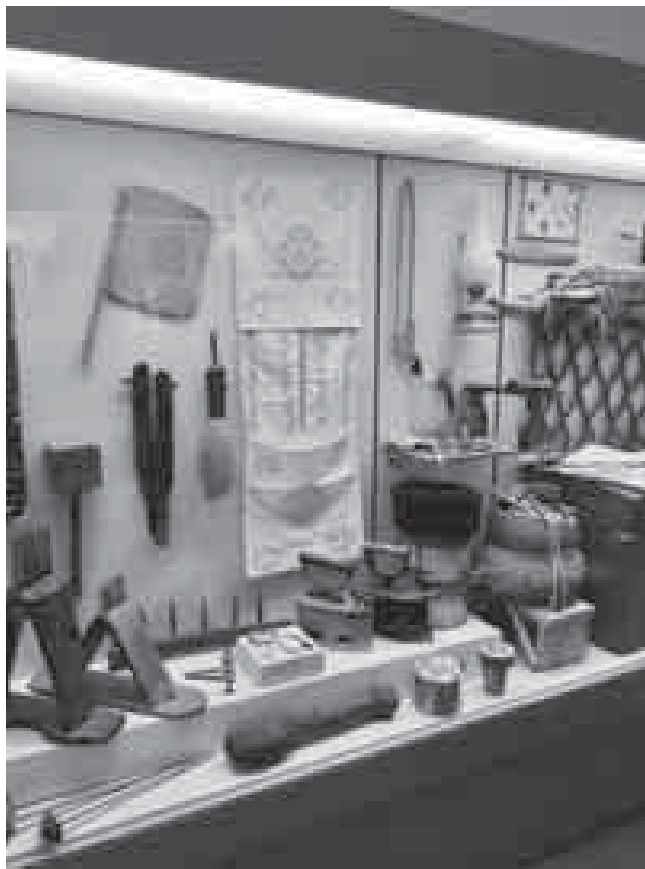
Кфар-Камэ дэт Адыгэ музейм щІэлъ хъэпшыпхэм ящыщІ.

Иджы тІууэ зэтету ягъэпса унэшхуэм зы махуи и бжэр зэхуащІыркъым. Нэхъапэм зы ильэсым цІыху 1-1,5-рэ къекІуалІэу шытамэ, нобэ ар мин 50-м нэсащ. ЗыплыхъакІуэхэм я процент блыщІыр абы ис журтхэращ. Абыхэм я нэхыбэр адыгэм и хыбар зэзыгъэщІэну хуейхэрщ. Процент 14 хуэдизыр хъэрыпщ. Адрей къэ-