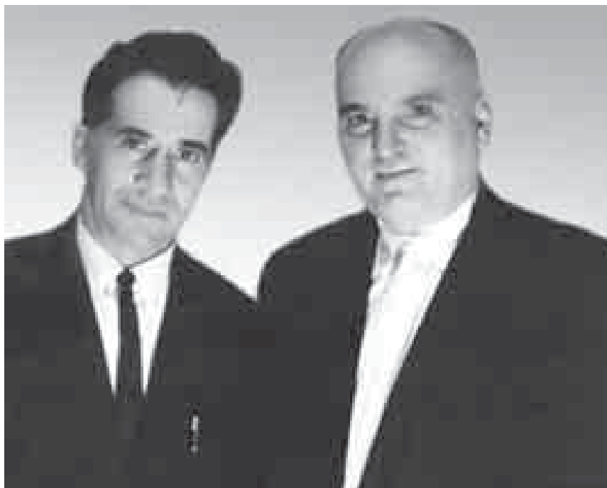
Щэныгээл, Iуэрыуатэдж КъардэнгушI Зырамыкурэ Шортэн Аскэрийрэ.