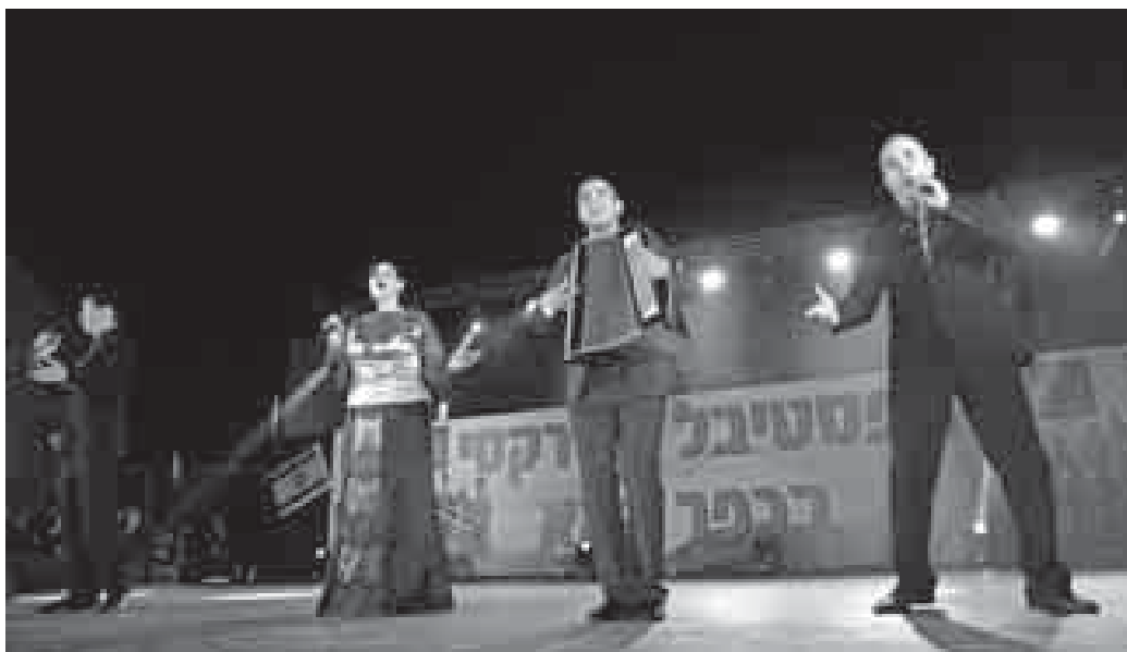
АР-м и «Ислъэмей» уэрэджыIакIуэ гупыр.

Израилым адыгэу исыр зыпэплъа махуэр кѳэсащ. Бадзэуэгъуэм и 30-м, щэбэтым, Кфар-Камэ щекIуэкIынут гъэ кѳэс кѳызэрагъэпэщ дунейпсо фестивалыр. БлэкIа ильэхэм Тыркум, Иорданием щыIэ адыгэ кѳэфакIуэ, уэрэджыIакIуэ гупхэр кѳрагъэблэгъамэ, иджы утыкум итынур «Кабардинка» кѳэрал академическэ ансамблымрэ «Ислъэмей» уэрэджыIакIуэ гупымрэт.