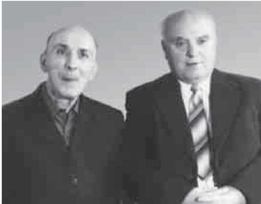
ТхакІуэхэу КІэрашэ Темботрэ Шортэн Аскэробийрэ.