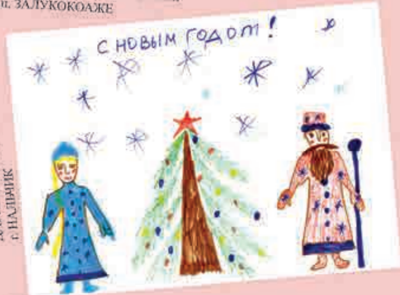
ИННА СЛОНОВА, 6 ЛЕТ, с. НАЛЬЧИК