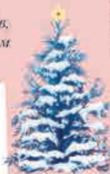
ДАРЬНА КУНАШЕВА, 4 ГОДА, с. НАЛЬЧИК