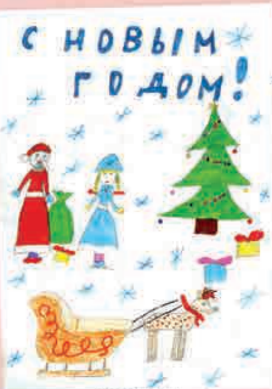
АМИНА ГЕРУЗОВА, 8 ЛЕТ, СОШ № 2, с.п. ВЕРХНЯЯ БАЛКАРИЯ