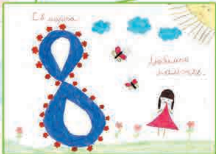
ДИНАРА КАНИХОВА, 1 КЛ. СОШ № 1, с. КАМЛЮКОВО