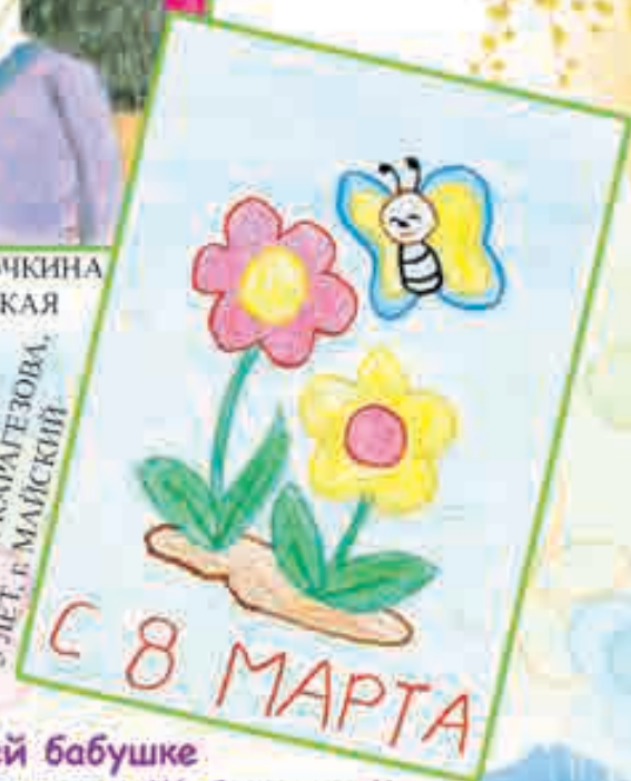
НАТАША КАРАГЕЗОВА, 5 ЛЕТ, г. МАЙСКИЙ