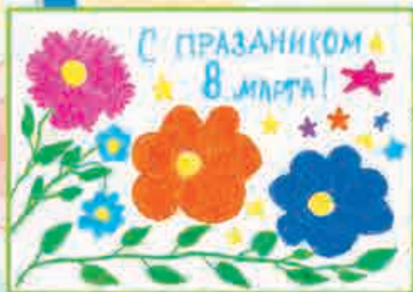
КИРИЛЛ МАЦУКОВ, 1 «А» КЛ., ПРОГИМНАЗИЯ № 13, г. МАЙСКИЙ