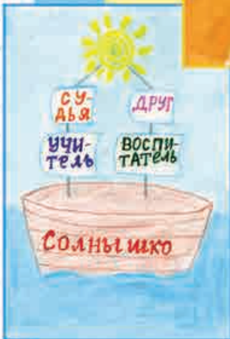
КИРИЛЛ МАЦКОВ, 2 «А» кл., ПРОГИМНАЗИЯ № 13, г. МАЙСКИЙ