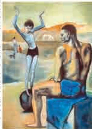
Девочка на шаре

На этой картине зрителю представлена репетиция уличной труппы. Тонкая и хрупкая девочка умело балансирует на неустойчивом шаре, а рядом с ней статичный и мощный гимнаст внимательно наблюдает за её работой, в любой момент он готов прийти ей на помощь. Эта картина получила ещё при жизни художника статус шедевра мирового искусства.