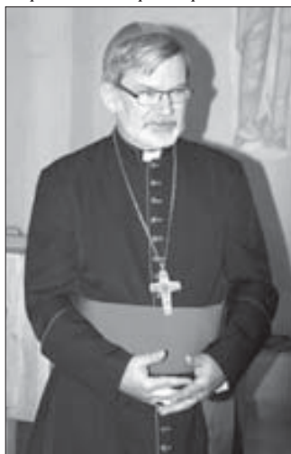
Епископ Клеменс Пиккель родился в г.Кольдич, ГДР. После окончания средней школы учился в семинарии «Норбертинум», в Высшей духовной семинарии святого Альберта Великого, в Духовной семинарии. Рукоположен в священники в июне 1988 г. Был vikarием в приходе Святой Марии Магдалины в г. Каменца.

по некоторым данным, 500-600 католиков, немногим более 100 – в Кабардино-Балкарии. Сегодня Россия поделена на 4 католических епархий с представительствами в Москве, Новосибирске, Иркутске и Саратове. В последнюю входит Юг России, в т.ч. Северный Кавказ. Апостольским администратором ее является 54-летний епископ Клеменс Пиккель. Недавно он побывал в Кабардино-Балкарии («СМ» №2) и встретился с нашим корреспондентом.