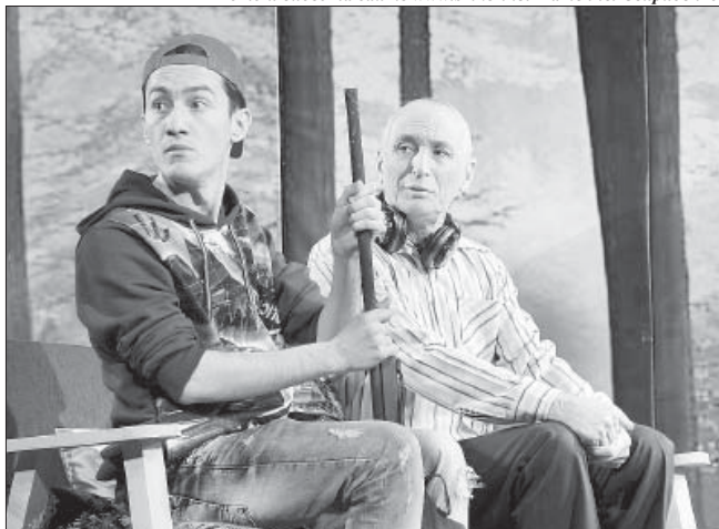
Фото и видео на сайте www.smkbr.net Татьяны Свириденко.