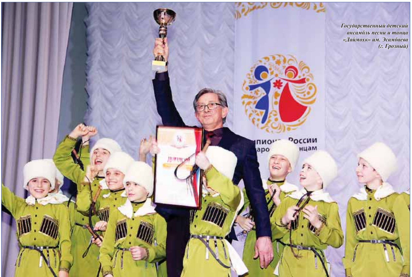
Государственный детский ансамбль песни и танца «Даймохк» им. Эсамбаева (г. Грозный)

Окончание на стр. 3