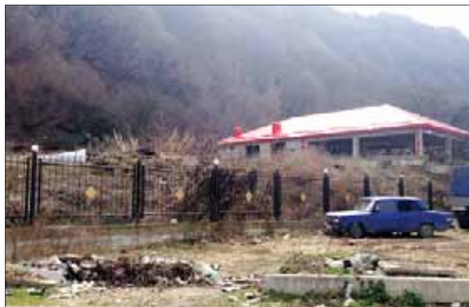
Через дорогу от реки. Здесь все только строится. Выкорчеванные деревья и кучи мусора «украшают» пейзаж.