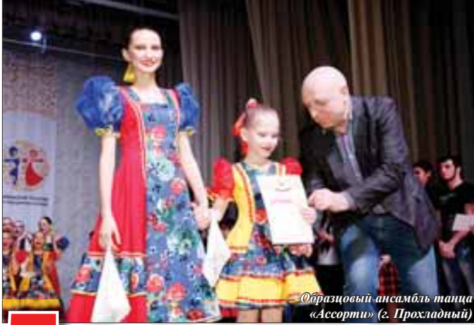
Образцовый ансамбль танца «Ассорти» (г. Прохладный)

УЧРЕДИТЕЛЬ - ПРАВИТЕЛЬСТВО КАБАРДИНО-БАЛКАРСКОЙ РЕСПУБЛИКИ