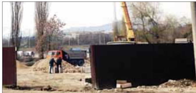
Здесь тоже стройка. Мы не знаем, есть ли разрешение, но количество техники на участке и масштабы работ впечатляют.