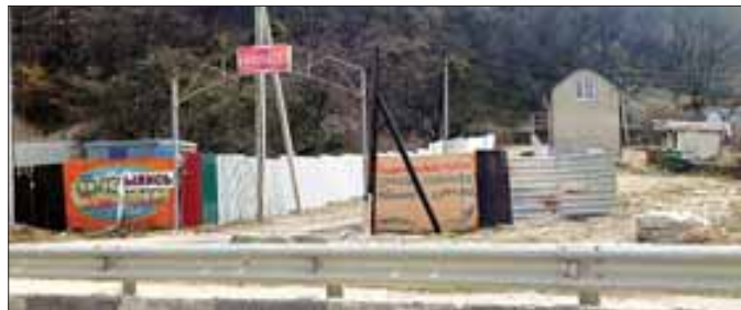
Кафе «Фазенда» у подножия горы сообщает: «Мы открылись». Рады за вас. Да, наверное, именно такими заведениями высокой культуры можно привлечь туристов в 21 веке.