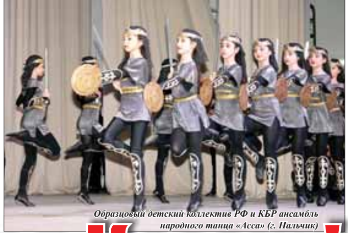
Образцовый детский коллектив РФ и КБР ансамбль народного танца «Асса» (г. Нальчик)