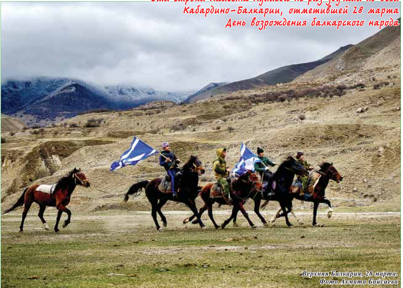
Верхняя Балкария, 28 марта.

- Эти строки Кайсына Кулиева не раз звучали по всей Кабардино-Балкарии, отметившей 28 марта День возрождения балкарского народа