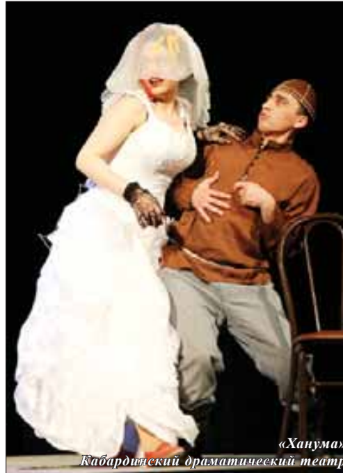
«Ханума» Кабардинский драматический театр

Открылся праздничный вечер кадрами документальных фото- и киноматериалов, запечатлевших классика кабардинской сцены в различных образах, которые сопровождалась воспоминаниями самого Али Матковича об истории его поступления в ГИТИС, которые до сих пор вызывают искренний смех и у современных зрителей.