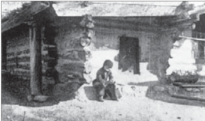
Аны сейирлиги жокъду, кыалай бир адам жокълайды бу юйю. Къонаклагъа деп павильон да ишленгенди, алай башха ото-

Иги кесек заман озгъандан сора эсибизге келеди: «Тайчыгыбызны тас этгенбиз да!» Сора, атларыбызны кызыуу чапдырып, келген ызыбыз бла артха барабыз. Мен аны кетюр кыулагында эселедим. Баям, ол кетюрдөн эттерге кюркюп, асаныны ызындан келмей, алайда кыалганды. Жюреклерибиз кыуанчдан толуп, артха, шухларыбызга, кыайтдык.