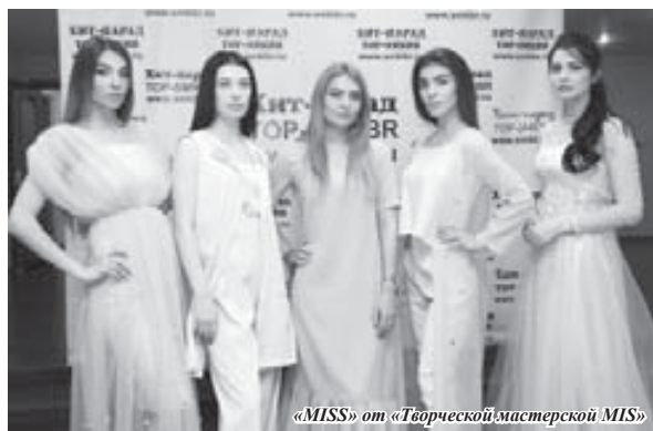
«MISS» от «Творческой мастерской MIS»

И, конечно, большим сюрпризом стал и показ, причем показ премьерный, модной коллекции «MISS» от «Творческой мастерской MIS». Вот такая примечательная игра