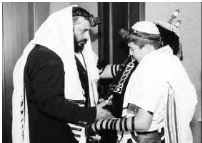
Фото было опубликовано в «Газете евреев Северного Кавказа» (ЕСК) №3, 2012 (2 Нисан – 16 Нисан / 25 марта – 8 апреля).